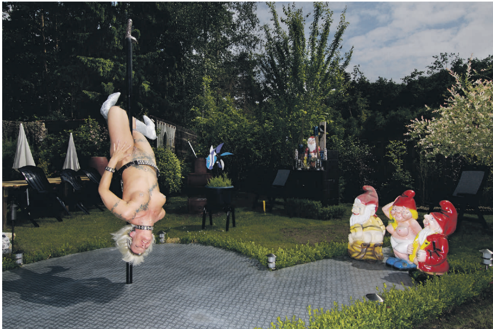
Shedevil in haar tuin op een caravanpark in Herselt, België.