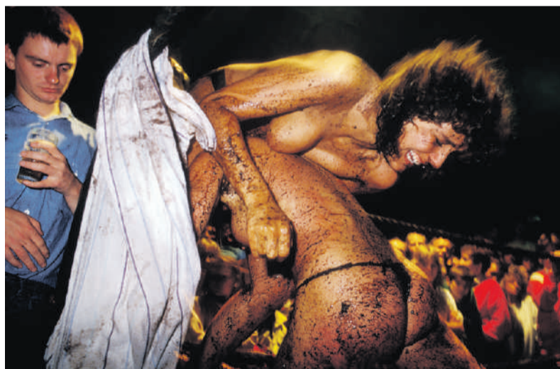
Modderworstelen tijdens motorcross familieweekend, Geel-Laakdal, België.

'Ik maak graag verborgen werelden zichtbaar', zegt Blok, die veel werkt of werkte voor Panorama , Revu , Der Spiegel en tal van magazines van Nederlandse kranten. 'Dat heeft te maken met mijn journalistieke nieuwsgierigheid. Daarnaast gaat het me goed af om in zo'n omgeving te werken.' Andere onderwerpen die Blok fotografeerde, waren de drugscene in het Rotterdamse Spangen, het werk van het Korps Commandotroepen, de omgang in inrichtingen met agressieve geestelijk gestoorden en het afgezonderde leven in een trappistenklooster.